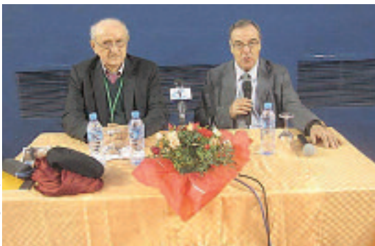
جانِب من النَّدْوَة

الصغير، وبالضبط في طور الدراسة. كما أشار إلى أهمية أن يحتك الطفل بالأفلام من خلال مشاهدتها بصفة منتظمة.