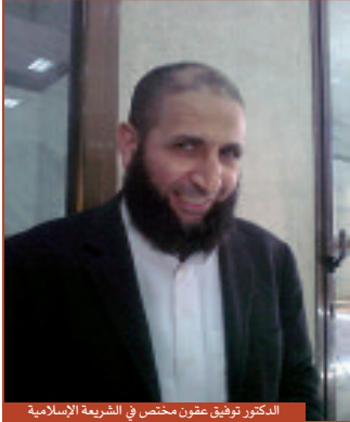
الدكتور توفيق غنوش مختص في الشريعة الإسلامية