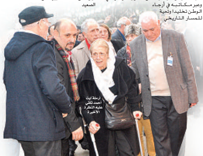
أرملة آيت أحمد تلتقى النظرة الأخيرة

مراسم تشييع الفقيه كانت وطنية وشعبية بكل المقاييس، بدأت من المطار، حيث واجه الموكب الجنائزي صعوبة في الخروج من القاعة الشرفية بالنظر إلى الحشد الكبير من المواطنين الذين قدموا