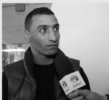
المستقدمون: بوشريط وصالح الدين. المقادرون: روبرسون، نقولا والاتصال بـ: لا أحد.

عقده في أي لحظة إن لم يتقنع بمستواه. المولودية تلعب على جبهتين بعد أن تأملت إلى الدور ثمن النهائي من كأس الجزائر. وتحتل المرتبة الثالثة في البطولة الوطنية؛ مما جعل الأنصار يأملون أن يتقدم فريقهم بعناصر يمكنها إعطاء الإضافة المرجوة. غير أن الرئيس بتروني رفض انتدابات أخرى رغم أن المدرب إيفيل طلب جلب لاعبين جدد.