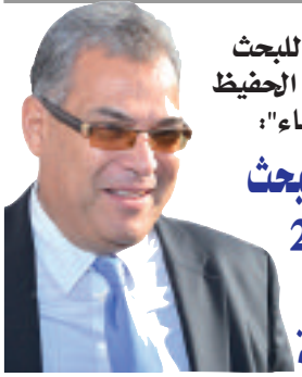
المدير العام للبحث العلمي عبد الحفيظ أورغ ل "المساء": ميزانية البحث العلمي 20 مليار دج هذه السنة

والتحول من مجرد أفكار مكتزنة في أدارج مديرية البحث إلى منتج اقتصادي، يمكنه السهر على تنمية الإنتاج المحلي وتحسين نوعيته. ويخصص عدد الباحثين الجزائريين المقيمين في المهجر والذين قرروا المساهمة في تطوير البحث الجزائري من خلال مشاركتهم في إتمام العديد من المشاريع البحثية ونقل معارفهم وخبرتهم للجامعات الجزائرية، أشار أورغ إلى عودة 100 باحث جزائري سنة 2014 إلى أرض الوطن، وهم يشرفون اليوم على تنفيذ العديد من البحوث في عدة مجالات، على غرار التكنولوجيات الدقيقة والطاقات المتجددة.