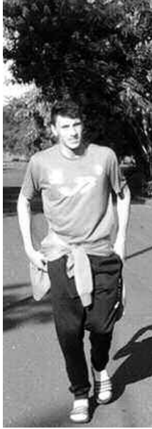
المباراة التي تغلب فيها "الخضر" على الغابون بواقع (35-24) أول أمس (الجمعة)، بقرار من التقني الوطني بوشكرو الذي فضل إراحته تحسبا للمواجهات المقبلة.