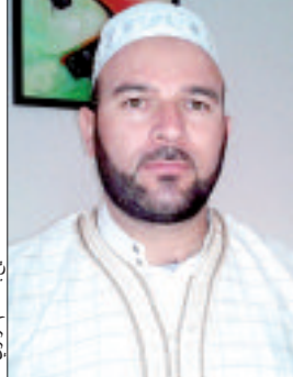
الشيخ مصطفى جرموني