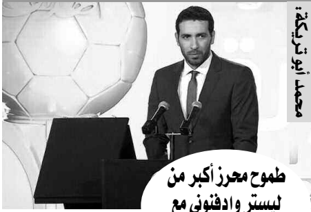
محمد أبو تريكة