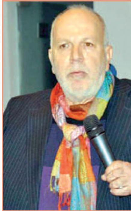
"إبداع الشباب، كلمات على الركح 1". كمنثل، ثم سرعان ما تحول

الخمسة إلى أعمال مسرحية، لتعطي ميلاد تظاهرة لقاءات من الوجوه البارزة في المسرح