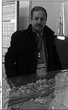
ممثلاً، ميناء مستغانم

الطابع التجاري في ولاية تلمسان، قال يأن الميناء يستقبل أقل من 17 سفينة، لأنه ضخم، حيث خصص فيه جانب للسفن التجارية، الأمر الذي أثر على السفن التجارية، مشيراً إلى أن هذا الاستغلال ينظر أن يحل في القريب العاجل بعد انتهاء الأشغال في ميناء جديد خاص بالصيد البحري في سبيدي وشة، ينظر أن يستلم السفن المقبلة، ليجري تحويل كل سفن الصيد إليه، ومنه يظل ميناء الغزوات تجارياً، وأضاف: "وفيما يتعلق بالمسافرين، فإن الخط الوحيد الموجود يربط بين الغزات وأرمينيا، محنة تأتي السفينة المحملة باليضايع برفقة المسافرين، هذا الخط يعمل بمعدل يومين في الأسبوع، مشيراً إلى وجود مشروع في الأفق يمثل في إقامة محطة مسافرين جديدة، يتم الفصل بين ما هو تجاري وما هو مسافر، حيث ستستجيب المحطة المنطرفة للمعايير العالمية، ومنه ينتظر أن يجري فتح خطوط جديدة لفائدة المسافرين.