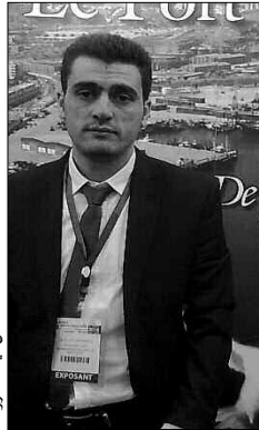
ممثلاً، مبناء الغزوات

الطابع التجاري في ولاية تلمسان، قال يأن الميناء يستقبل أقل من 17 سفينة، لأنه ضخم، حيث خصص فيه جانب للسفن التجارية، الأمر الذي أثر على السفن التجارية، مشيراً إلى أن هذا الاستغلال ينظر أن يحل في القريب العاجل بعد انتهاء الأشغال في ميناء جديد خاص بالصيد البحري في سبيدي وشة، ينظر أن يستلم السفن المقبلة، ليجري تحويل كل سفن الصيد إليه، ومنه يظل ميناء الغزوات تجارياً، وأضاف: "وفيما يتعلق بالمسافرين، فإن الخط الوحيد الموجود يربط بين الغزات وأرمينيا، محنة تأتي السفينة المحملة باليضايع برفقة المسافرين، هذا الخط يعمل بمعدل يومين في الأسبوع، مشيراً إلى وجود مشروع في الأفق يمثل في إقامة محطة مسافرين جديدة، يتم الفصل بين ما هو تجاري وما هو مسافر، حيث ستستجيب المحطة المنطرفة للمعايير العالمية، ومنه ينتظر أن يجري فتح خطوط جديدة لفائدة المسافرين.