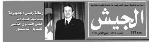
الفريق أحمد قايد صالح في زيارة عمل وتفقد للناحية العسكرية الرابعة والخامسة

عدد المجلة تضمن أيضا حصيلة حول عمليات الجيش خلال الشهور الأولى من عام 2016 لا سيما فيما يتعلق بمكافحة الإرهاب والتي تتمثل في القضاء على إرهابيين واعتقال آخرين وحجز أسلحة وذخائر حربية وإيقاف المهربين والمهاجرين غير الشرعيين، من جانب آخر سلطت المجلة الضوء على الجرائم الإنسانية المرتكبة في حق الجزائريين من قبل فرنسا والمتمثلة في التجارب النووية الفرنسية في الصحراء الجزائرية والتي لا تزال عواقبها السلبية إلى اليوم، مشيرة إلى أنه بعد 54 سنة من استقلال الجزائر لا زالت فرنسا لا تعترف بضحايا التفجيرات النووية بالصحراء الجزائرية ولا بالبيئة الملوثة بالإشعاعات بسبب الانتقائية والمحدودية التي تميز قانون موران، المتعلق بالاعتراف والتعويض لضحايا التجارب النووية.