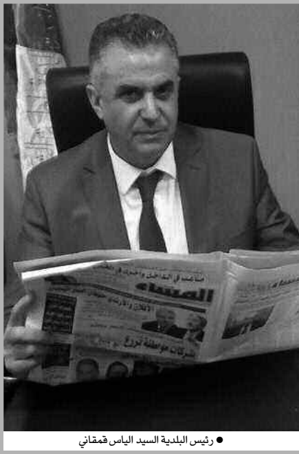
● رئيس البلدية السيد الياس قمقاني