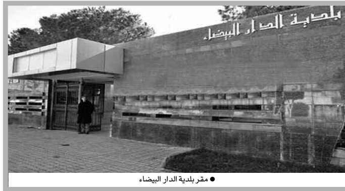
● مقر بلدية الدار البيضاء

للصحة الجوية بالمنطقة، غير أن مسؤولي بلدية الدار البيضاء يواجهون متاعب مع بعض المقاولين الذين يتهاونون في تسليم المشاريع في وقتها المحدد، مما أدى إلى فسخ القد في حالتين، واحدة منها بسبب رفض المقاول إكمال المشروع الذي أسند له في حي عبان رمضان.