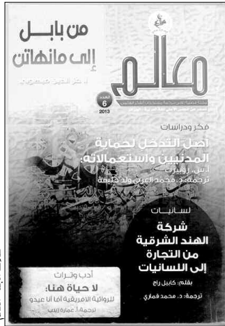
غلاف مجلة معالم

و بهذا الصدد و طبقاً لأحكام المادة 114 من المرسوم الرئاسي رقم 236/10 المؤرخ في 2010/10/07 المنصم تنظيم الصلقات العمومية، المعلن والمعلن، يمكن للمشاركين في هذه المنافسة تقديم طلبهم لدى لجنة الصلقات العمومية لوزارة الشباب والرياضة في أجل لا يتعدى 10 أيام ابتداء من تاريخ أول نشر لهذا الإعلان في الصحف الوطنية.