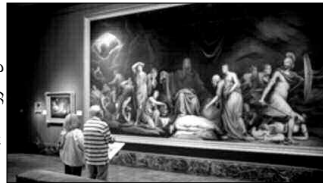
من مجموعات المتحف

قد تستخدم المجموعة الرائعة التي يحويها متحف الفن في ديترويت التي تعاني الإفلاس لتحسين مالية المدينة، رغم معارضة محبي الفن الذين يحتجون على هذا الحل. ففي مطلع أكتوبر المنقضي، قال الحارس القضائي للمدينة كيفين أور بأنه مضطر في إطار مهمته إلى تقييم كل أصول المدينة، وفي قضايا الإفلاس كل شيء يطرأ على الطاولة". (الوكالات)