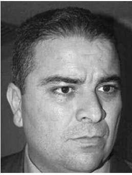
سقطوا في فترة الـ63: لأنهم شهداء الواجب الوطني.