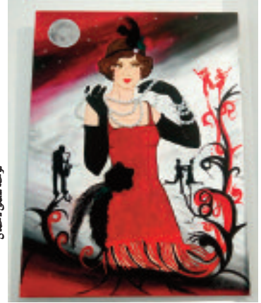
لوحة سلمى دحماني

قالوا "لالمساء" .. راكال روميرو (مديرة سرفنتس): أدعو الفنانين لعرض أعمالهم بفضاء "إسبانيا"