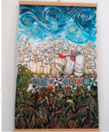
لوحة ماسية دحماني