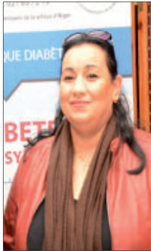
تشكي مرض السكري بشكل ملفت للانتباه.