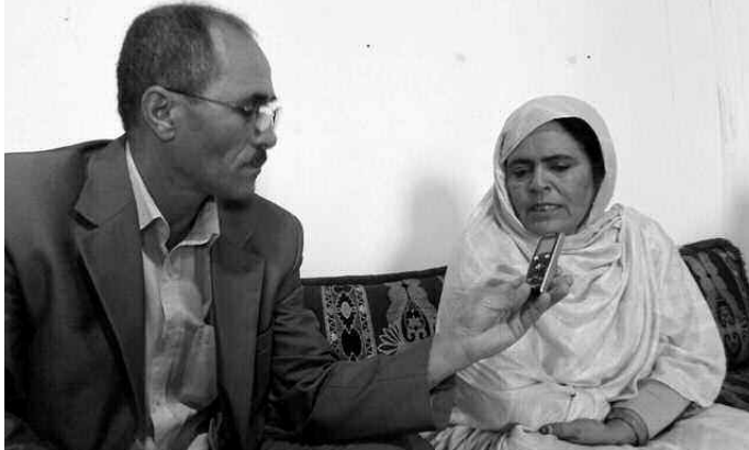
الصحراوية بالمهجر في ترويج للقضية الصحراوية؟