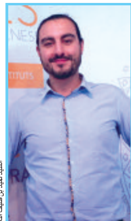
من تراشا الغني.

الصالونات المذكورة، نظرا للاهتمام الكبير الذي توليه الفتيات والسيدات لها، سواء من جهة تعليمهن حرفة تقيهن غدر الزمان، خاصة أن الاندماج فيها وتعلم أصولها