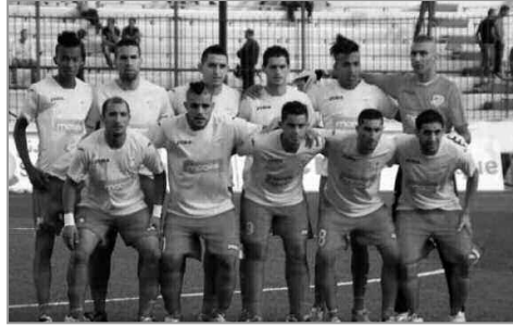
اتحاد بلعباس من جهة أخرى. وستستقبل المولودية (الرابطة المحترفة الأولى) وصاحبة 7 كؤوس، بملعب 5 جويلية، أصغر فريق في هذا المستوى من المنافسة، فريق اتحاد تبسة (قسم الهواة/ شرق). أما نصر حسين داي