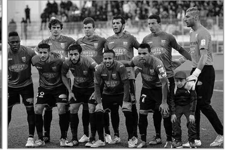
أسفرت عملية القرعة للدور نصف النهائي لكأس الجزائر لكرة القدم (أكبر) التي جرت أمس (السبت) بمقر التلفزيون الجزائري، عن وقوع مولودية الجزائر في مواجهة اتحاد تبسة من جهة، ونصر حسين داي ضد

بعدهما أكد براف بأن الضيفا ستسمح لهم بلعب الأولمبياد