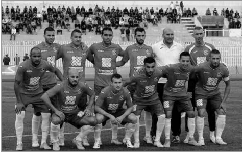
(الرابطة الأولى) فسيواجه اتحاد بلعباس (الرابطة الثانية) بملعب مصطفى تشاكر بالبلدية، وستجري مبارات المربع الذهبي يومي 15 و16 أبريل المقبل.