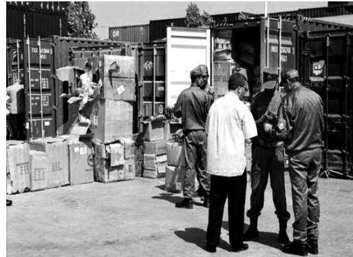
أخرى، وهو ما يقابله، بالضرورة، رسوم إضافية على المستوردين، الذين وجدوا أنفسهم في ورطة تحقيق الربح، فكانت إضرابة على المستوردين، الذين وجدوا

للمواطن: حيث تم رفض 986 طنا من مختلف المواد والسلع غير المسموح بإدخالها إلى التراب الوطني، وهو ما جعل أصحابها في ورطة إزاء طريقة التعامل مع سلعهم، التي من المفروض أن يعيدها إلى البلد الذي تم استيرادها منه أو إتلافها، خاصة أن مصالح مديرية الجمارك لم تسمح بإدخال هذه السلع إلى السوق؛ كونها مضرّة كثيرا بالصحة العمومية، كما أن مديرية البيئة التي تم إخطارها بالموضوع، رفضت المشاركة في إتلاف هذه السلع إلا بشروط تتماشى والحفاظ على البيئة والمحيط، وهو ما اعتبره الكثير من المستوردين أمرا مكلفا ماليا، مما جعل الكثير منهم يفكرون في أقل الأضرار، وهو إرجاع السلع إلى بلد المنشأ، خاصة أن مديرية الجمارك تلج على أصحاب هذه الحاويات بوجوب تحرير الأمكنة من أجل استغلالها لأمو