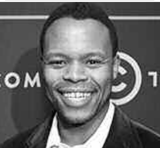
تومبوش ماشا في دور ماندبلا

1962، وتلقَّى تدريباً عسكرياً في المغرب وإثيوبيا. ويتذكر ماندبلا في سيرة حياته تدريبه على استخدام السلاح وضع عبوات ناسفة والغام صغيرة، كما زار بريطانيا في العام نفسه بهدف تحشيد الدعم للمكافح المسلح ضد النظام العنصري، وفي جويلية عام 1962 عاد إلى جنوب إفريقيا؛ حيث أُعتقل بعد شهر في حجاز تفتيش لشرطة النظام، ثم سُجن نحو 30 عاما في جزيرة روبن.