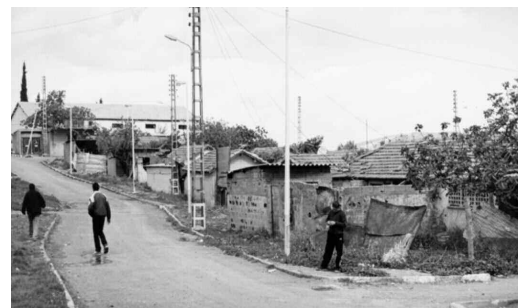
على غرار البلديات الريفية الأخرى عبر الولاية، استفادت بلدية ذراع القائد الواقعة بشرق ولاية بجاية والتابعة إقليميا