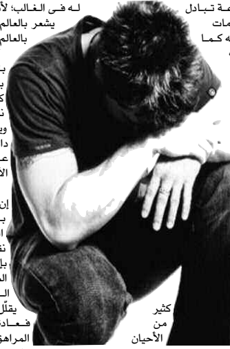
كثير من الأحيان

في بعض الأوقات من الممكن أن نناقش بيننا وبينهم، فنقول لهم: (عندما كنت في سنك مرتب بما تمر به الآن)، وهي عبارة خاطئة أيضا: لأن سنك بالنسبة له كان في عصر قديم؛ لم يكن هناك وسائل الترفيه الموجودة حاليا كالتنترنت