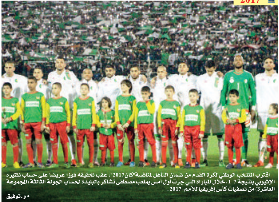
اقترب المنتخب الوطني لكرة القدم من ضمان التأهل لمنافسة "كان2017"، عقب تحقيقيه فوزا عريضا على حساب نظيره الإثيوبي بنتيجة 7-1، خلال المباراة التي جرت أول أمس بملعب مصطفى تشاركر بالبلدية لحساب الجولة الثالثة (المجموعة العاشرة) من تصفيات كأس إفريقيا للأمم-2017.