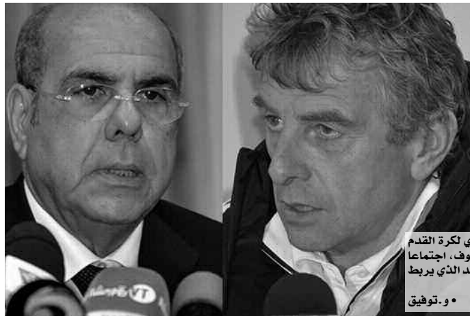
يقعد غدا الأحد، رئيس الاتحاد الجزائري لكرة القدم محمد روراوة، والمدرّب كريستيان غوركوف، اجتماعا بمقر "الفاف" من أجل البحث في قضية العقد الذي يربط المدرب الفرنسي بالمنتخب الوطني.