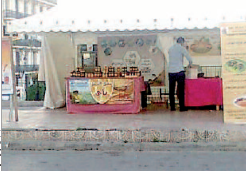
جانب من معرض العسل

التي تأخر الذي عرفه تساقط الأمطار هذه السنة. يضيف مربو النحل باي من بلدية سيدي موسى، من شأنه أن يؤثر على وفرة بعض الأنواع من العسل، ما يعني أننا. يقول. سنشهد موسما أضعف في مادة العسل بالمقارنة مع السنة الماضية، من أجل هذا نتمنى أن تتهاطل الأمطار شهر أبريل يفتح أكبر قدر من الأزهار وتحديدًا أزهار أشجار البرتقال وغيرها من الحمضيات بالنسبة لمنطقة المتيجة وليتمكن النحل من الرعي خاصة وأن موسم نصب خلايا النحل بالحقول قد بدأ بعد الانتهاء من عملية التكاثر، مشيرا إلى أنه من بين أكبر المشاكل التي يعاني منها مربو النحل مع الفلاح، تلك التي تتعلق برش حقوله بالمبيدات في الوقت الذي ترعى فيه النحلة، الأمر الذي ينجر عنه وفاة النحل وهو الآخر يؤثر أيضا على وفرة العسل.