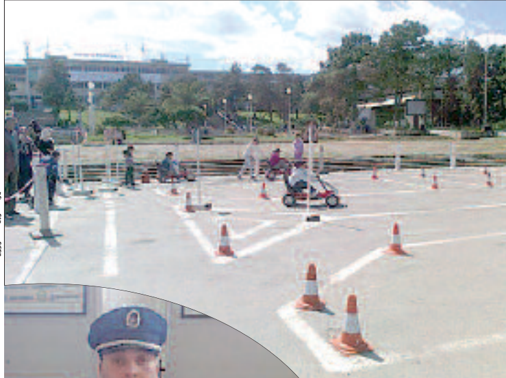
خطبة التربية المرورية