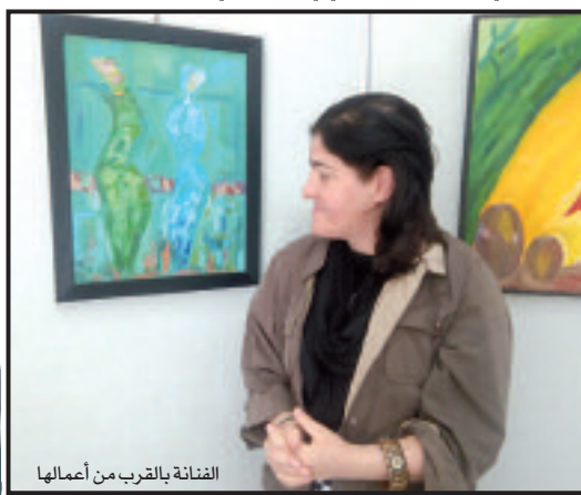
الفنانة بالقرب من أعمالها

وتعلمت سعاد الرسم بالقلم في المدرسة، واختصت في الرسم الزيتي، ثم انتقلت إلى الرسم بالأكريليك سنة 2014، وكانت النتيجة عدة لوحات بالفن التجريدي، في حين تخصصت الفنانة في الفن شبه التجريدي بالنسبة للوحاتها الأخرى، حيث تهتم أيضا بتفاصيل الطبيعة وكذا الحياة اليومية للشعوب. وجاءت لوحة "الثرة" تعبر عن امتناع