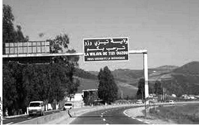
صورة من أرشيف

وأكد المصدر، أن ولاية تيزي وزو تتميز بتساقط كميات هائلة من الأمطار التي يصل معدلها السنوي إلى 800 ملم. وقد تم تسجيل خلال فصل الشتاء الماضي (2014-2015) 940 ملم، في حين تم تسجيل 520 ملم من الأمطار خلال هذا الشتاء إلى غاية 22 مارس الماضي. واستنادا إلى المديرية، فإن سيالان الوديان يمثل ثروة مائية معتبرة نوعا ما ولكن في غياب هياكل مائية لحشد هذه المياه السطحية، فإن ازدياد من 808 مليون متر مكعب من مياه الأمطار وذوبان الثلوج تصب سنويا في البحر دون الاستفادة منها.