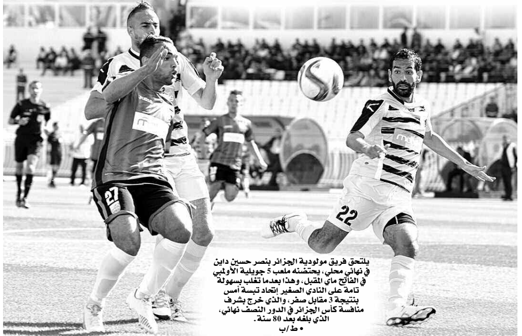
يلتحق فريق مولودية الجزائر بنصر حسين دايين في نهائي محلي، يحتضنه ملعب 5 جويلية الأولمبي في الفاتح ماي المقبل، وهذا بعدما تغلب بسهولة تامة على النادي الصغير اتحاد تبسة أمس بنتيجة 3 مقابل صفر، والذي خرج يشرف منافسة كأس الجزائر في الدور النصف نهائي، الذي يلعبه بعد 80 سنة.

لصالح المولودية، أمام فريق لم يسجل أي محاولات خطيرة، ليضيف العميد الهدف الثالث عن طريق كرة ثابتة، بعد تنفيذ حشود لمخالفة مباشرة في الدقيقة 63، الهدف الذي قضى على أحلام أبناء تبسة، الذين جاءوا إلى العاصمة بنية أحداث المفاجأة، رغم تنقل أنصارهم بما يكثر من 50 حافلة، إلا أن هذا الفريق الذي بلغ هذا الدور من المنافسة، يخرج بشرف، لأنه أقصى أندية كبيرة، ولعب بكل إمكانيته ضد المولودية في مباراة الأمل، لكن النهائي اختار العميد ليواجه النصرية. وكان نصر حسين داي قد تأهل إلى الدور نصف النهائي ضد اتحاد بلعباس بنتيجة (1-0) يوم الجمعة الماضي بنفس الملعب، وعليه يلتقي فريقا مولودية الجزائر ونصر حسين داي في المباراة النهائية، ليكون النهائي عاصمي 100 بالمائة.