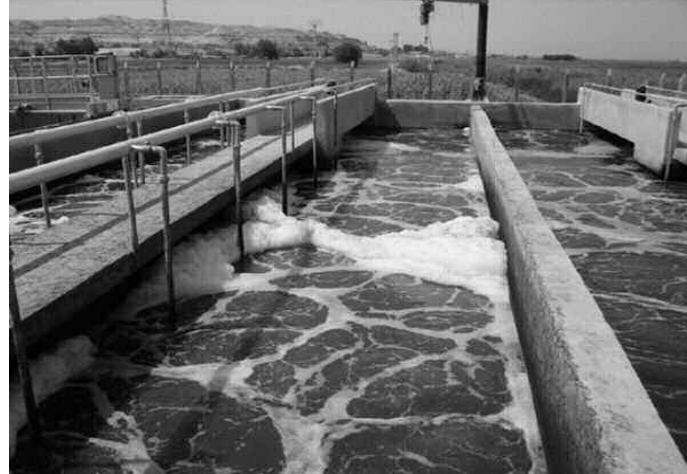
رئيسة للمياه المستعملة.

كما تحدثت نفس المسؤول عن اقتراح إنشاء 4 محطات للتصفية الجديدة ضمن برنامج 2014-2019 من أجل حماية الولاية من خطر التلوث والفيضانات، بقيمة 9 ملايين دينار بدل تلك التي لم تعد صالحة بسبب الإهمال وعدم الصيانة، والتي تسببت في تراكم الأوحال.