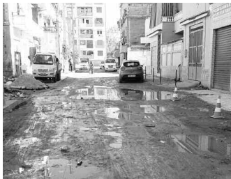
صورة لأحد المسالك المهترئة بمدينة سكيكة.

ينتقد أصحاب المركبات ومختلف الناقلين الخاص بمدينة سكيكة، الوضعية غير اللائقة التي آلت إليها معظم طرق المدينة التي لم تعد صالحة للاستعمال؛ بسبب الحفر والأخاديد التي أضحت السمة المشتركة بكل شوارع المدينة ما عدا تلك التي يعبرها المسؤولون، ولم تسلم حتى تلك التي تم تعييدها منذ أكثر من 03 سنوات، حيث بدأت أجزاء كبيرة منها تتآكل، كما هي الحال بالشارع الرئيس ممرات 20 أوت 55، حيث تسبب هذا الوضع في اختناق مروري لا يطاق. وقد فرضت هذه الوضعية على سكان الأحياء شبه عزلة خاصة عند عتوط الأمطار؛ بسبب رفض أصحاب السيارات والمركبات التوجه نحوها؛ لكون تلك الطرقات غير صالحة للاستعمال؛ ما زاد في تعقيد الأمور بسبب عمليات الحفر التي لا تنتهي، وتسريبات الماء التي تؤثر في الأخرى على الطرقات وغياب الصيانة، خاصة من قبل مصالح البلدية، مستغربين غياب تدخل الجهات الوصية، وعلى رأسها البلدية رغم شكاويهم المستمرة.