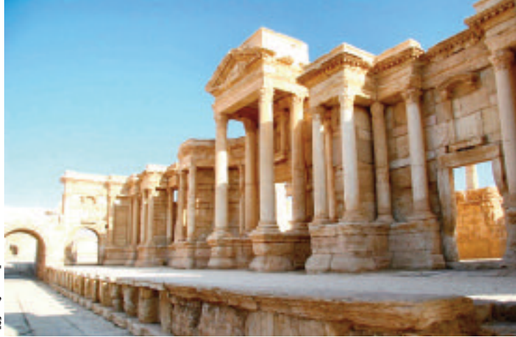
مدينة تلمس السور