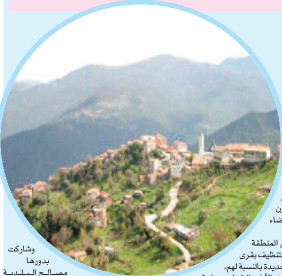
وشارك بدورها مصالح البلدية بإمكاناتها المادية والبشرية

على الأبواب إذ تعرف القرى حركة وإقبال كبيرين للمغتربين والقاطنين ببض ولايات الوطن الذين يقصدون المنطقة من أجل قضاء عطلة بين ذويهم.