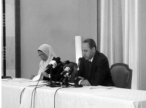
باجين من الندوة

عقد وزير الثقافة السيد عز الدين ميهوبي، ندوة صحفية أمس، بقصر الثقافة للحدث عن قائمة المهرجانات المعتمدة هذه السنة، فقال إنه تم دراسة حالة بحالة وضعية المهرجانات وكذا تقييمها المالي، ليتم إعداد قائمة 77 مهرجاناً (28 دولياً، 31 وطنياً و18 محلياً) بعد أن كان عددها يجاور 200، وكذا تقليص ميزانياتها، إضافة إلى استغلال مخلفات ميزانيات المهرجانات المنظمة السنة الفائتة، والتي وصلت إلى نسبة 39.28 بالمائة.