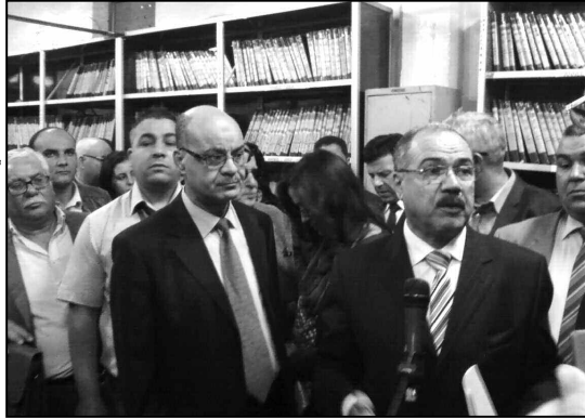
والي قسنطينة السيد حسين واضح مع مسؤولي الإدارات.

وحسب الوالي الذي كانت له أول خرجة رسمية ببلدية قسنطينة، منذ تنصيبه على رأس الجهاز التنفيذي قبل أسبوعين، لتفقد مختلف المشاريع، استعدادا لتظاهرة "قسنطينة عاصمة الثقافة العربية 2015"، فإن رؤساء الدوائر والبلديات والمديرين التنفيذيين، ملزمون بتغيير برنامج عملهم لتخصيص يوم الاثنين كاملا لمناقشة المواطنين والنظر في انشغالهم، مؤكدا أن كل الاجتماعات والخرجات الميدانية التي كانت مبرمجة يوم الاثنين ستلغى وتحول إلى أيام أخرى، باستثناء الأعمال التي لا يمكن تحويلها على غرار استقبال الوفود الأجنبية أو الوفود الحكومية.