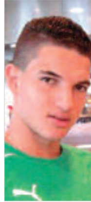
وقد دعم المدرب السويصري أندري بيار شورمان صفوف

المنتخب بكل من بونجاح وأيت عثمان، في غياب لاعب اتحاد العاصمة زين الدين فرحات، الذي لم يلتحق بالترتيب والتأديب للنفاد غدا الإثنين، فمن الممكن جدا أن تصدر في حقه عقوبات صارمة بسبب تقيئه غير المبرر عن انطلاق التريب التحضيري تيكجدة، وليست المرة الأولى التي لا يلتزم فيها فرحات بالانضباط مع المنتخب الأولمبي، حيث عوقب شهر جويلية من السنة الماضية بإبعاده عن الفريق الوطني، وهذه المرة إن لم ترحمه لجنة الانضباط فمن الممكن أن يضطر عن نفسه المشاركة في الألعاب الأولمبية القادمة بريدو دي جانير.