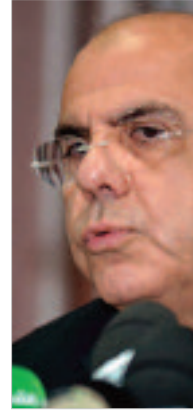
عن الجزائر، التي غابت عن هذه الألعاب منذ 36 سنة.

وتطرق رئيس الفاف للجوانب الرياضية والإدارية والتتظيمية المتعلقة بالتحضير في أحسن الظروف للفريق الوطني الأولمبي: استعدادا لموعد البرازيل، حيث حث اللاعبين على ضرورة إعطاء كل شيء والجدية لكي يكون المنتخب في أتم الاستعداد في ريو دي جانير، خاصة أن الاتحادية الجزائرية لكرة القدم وضعت كل الإمكانيات اللازمة تحت تصرف الفريق الوطني الأولمبي لأجل إجراء تحضيرات جيدة، سيما أن هدف الفاف هو محاولة الذهاب بعيدا في الألعاب الأولمبية، بتحقيق نتائج إيجابية وإعطاء أحسن صورة