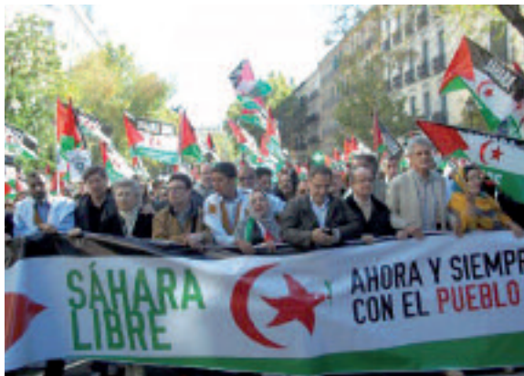
مظاهرة بتدبير بالإستعمار المغربي في مدينة

المشواطي والمحاكمات غير قانونية". كما اعتبر الكاتب أن تقرير تانوك الذي صادق عليه مؤخرا البرلمان الأوروبي، "يبرز الظروف المتوفرة لممارسة قمع وحشي منذ عقود خلت، معربا عن ارتياحه لكون البرلمان الأوروبي تمكن أخيرا من الاطلاع على وضعية حقوق الإنسان بالصحراء الغربية، التي تُضرب فيها هذه الحقوق عرض الحائط". وفي نفس الوقت الذي أشاد المدافع عن القضية الصحراوية بتصريح أوجا الذي "فصل" بمثاليته، فقد كشف عن إنشاء "مجموعة عمل" لحمل المغرب على الامتثال للوائح الأمم المتحدة، والتي "عملت الرابطة على حرقها من أجل تعزيز احتلالها غير الشرعي للصحراء الغربية ونهب ثرواتها الطبيعية". من جهة أخرى، وصف الكاتب دور حركة دعم نضال الشعب الصحراوي من أجل تقرير مسير، "بالرائدة"، مؤكدا أنه "هو من يدين في أوروبا الأعمال السيئة التي ترتكبها المملكة المغربية في حق الصحراويين أمام صمت وتواطؤ الدولة الفرنسية". وقال إنه من "الجميل أن نقوم بعمليات مذهلة، ونقوم وسائل الإعلام بالترويج لها بشكل واسع في ليبيا أو مالي، غير أنه من الرياء أن نسجل في المقابل مدى تمسك باريس ببقاء الوضع على حاله في الصحراء الغربية، من خلال مساندة سياسة الرابطة وتزكية الاحتلال غير الشرعي لهذه الأراضي والجرائم المرتكبة هناك".