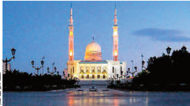
مسجد الأمير عبد القادر