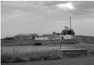
الصورة من الأرضين

لا يزال مشكل تثبيث الأراضي الخاصة بالبناء الريفي بقسنطينة، يؤرق المستفيدين من هذا البرنامج بالمعديين من بلديات الولاية، بعد أن طالب المستفيدون من برنامج البناء الريفي ببلدية عين اعبيد السلطات المحلية بضرورة الإسراع في تجسيد هذا البرنامج، الذي يعرف تأخراً رغم أنهم استوفوا كل الشروط الضرورية إلى أجل مباشرة بناء مساكنهم، حيث حال انعدام الوعاء العقاري في