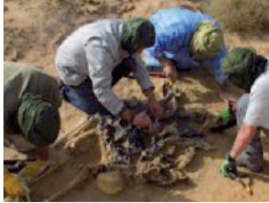
رفات الصحراويين العزل

ونظم مئات الصحراويين وقفة احتجاجية سلمية بهذه المدينة الواقعة في أقصى جنوب الصحراء الغربية المحتلة؛ للتضديد بسياسة الانتهاكات الفظيعة لأدنى حقوق الشعب الصحراوي، ونهب خيرات وثرواته الطبيعية. وبغير المواثون الصحراويين خلال هذه الوقفة، عن تضامنتهم المطلق مع النشطاء الصحراويين، اللاتي تعرضن للاعتداء من قبل قوات القمع المغربية في السادس من نوفمبر الجاري بمدينة بوجدور. ومع كافة المعتقلين السياسيين الصحراويين بالسجون المغربية.