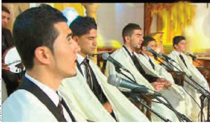
فرقة "ندى" الفنية من تيزي وزو

ميهوبي يؤكد على إنجاح مهرجانات الفناء الملتزم والنظيف