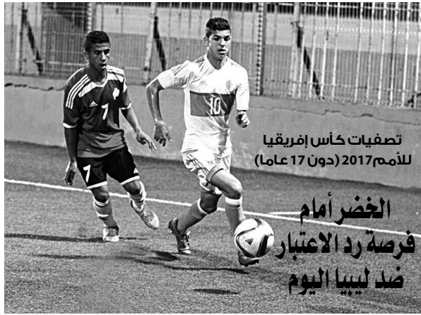
تصفيات كأس إفريقيا للأأمم 2017 (دون 17 عاما)