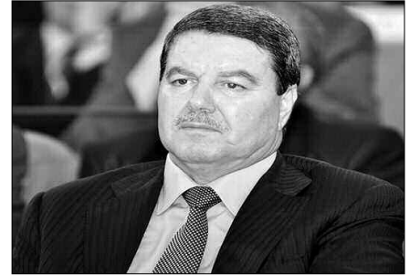
سقطت المديرية العامة للمرورية شاملة لتأمين احتفالات أيام عيد الفطر للأمن الوطني خطة أمنية

المبارك التي ستزامن مع الاحتفالات المخلدة للذكرى 54 لعيد الاستقلال. وأقاد بيان من المديرية العامة للأمن الوطني أمس الأول أن المدير العام للأمن الوطني، اللواء عبد الغني هامل أعطى توجيهات خاصة، حث فيها جميع مصالح الشرطة بمختلف اختصاصاتها على القيام بمهامها وواجباتها ومتابعتها وفقا للخطة الأمنية المسطرة لتأمين احتفالات أيام عيد الفطر المبارك التي ستزامن هذه المرة مع الاحتفالات