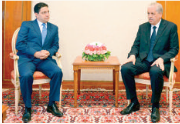
أجهزة الأمن عثمان طرطاق وعن الجانب المغربي مدير الادارة العامة للدراسات وسفير المغرب بالجزائر عبد والمستندات ياسين المنصوري. الله بلقزيز.

استقبل الوزير الأول، عبد المالك سلال، أمس، بالجزائر العاصمة المبعوث الخاص للملك المغرب، محمد السادس، حاملا رسالة المغرب لرفيس الجمهورية عبد العزيز بوتفليقة، حسبما أفاد به بيان لمصالح الوزير الأول. (واج)