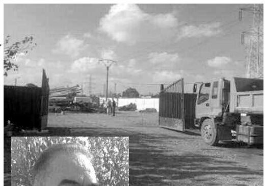
انطلاقاً من عملية التطعيم والتحصين، وبما أن ذلك و

وفي سياق متصل، تم تخصيص مبلغ 300 مليون سنتيم من أجل إنجاز الدراسات الخاصة بالأسواق المغطاة لأحياء 400 مسكن بالدالية، روضة الأطفال بحي بيلو 02 بمبلغ 200 مليون سنتيم، ومجمع الإدارة لخدمة الدالية بـ 800 مليون سنتيم.