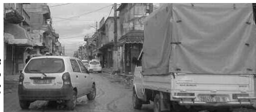
صورة من الأشياء

وتزفيت الطرق التي لم تمسسها العملية منذ سنوات عديدة، خاصة ونحن مقبلون على فصل الشتاء. للاشارة، فإننا اتصلنا هاتفيا بالجهات المعنية لتوضيح بعض النقاط الخاصة بهذه الوضعية، لكن لم نتلق أي رد.