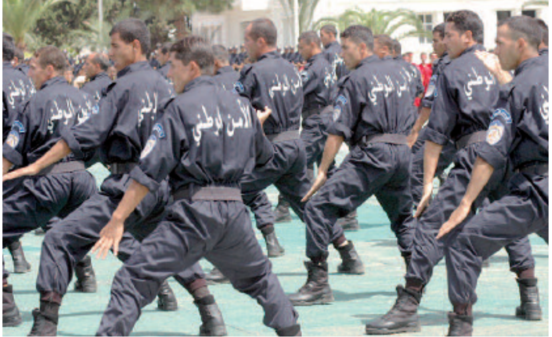
تحتضن ولاية وهران اليوم الاحتفالات الرسمية بالعيد الوطني الـ 54 للشرطة المصادف 22 من شهر جويلية، تحت إشراف وزير الداخلية والجماعات المحلية السيد نور الدين بدوي والمدير العام للأمن الوطني اللواء عبد الغني هامل.