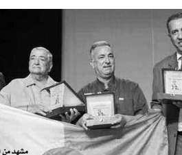
مشهد من التكرم

ساهمت في الرفع من معنوياته، كما قدم شكره لسكان الباهية وهران الذين وقفوا إلى جانبه أيام مرضه ومدوا له يد المساعدة، فيما شكر حميد إدارة المهرجان التي اختارت أن ترد الاعتبار لفرقة "بلا حدود" بعد 8 مطبات كاملة من عمر المهرجان.