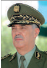
الواء أحمد بوسيطيلة

يشارك وفد جزائري هام ممثل بكل من قائد الدرك الوطني اللواء أحمد بوسيطيلة والمدير العام للأمن الوطني اللواء عبد الغني هامل، منذ أمس الثلاثاء، في الصالون الدولي 1821 للأمن الداخلي (ميليبيول - باريس 2013) الذي يقام في العاصمة الفرنسية من 19 إلى 22 نوفمبر.