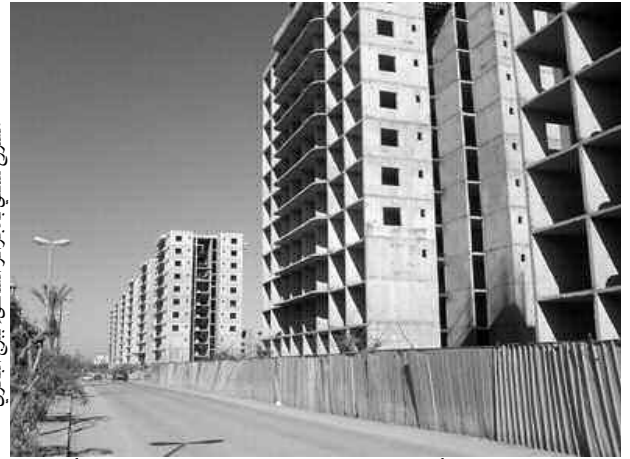
مشروع سكني بالجزائر

أما بخصوص السكن الاجتماعي، ففاد عدد الطلبات الخمسة آلاف، بينما استفادت البلدية من مشروعين: الأول كان سنة 1990 يضم 40 مسكنا، أما مشروع التسييم البحري الذي أنجز فيه 300 مسكن فلم يستفد سكان البلدية سوى من 100 مسكن، تبقى الحصة السكنية ذات الصيغة الاجتماعية الأقل من بين المشاريع السكنية، وهي الصيغة الموجهة لفئة الهشة من المجتمع، كون أغلبية العائلات لا طاقة لها بدفع المستحقات المالية الخاصة بالسكن التساهمي أو الترقوي.