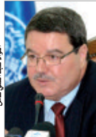
الواء عبد الحقي هامل

مجال الأمن، "مضيضا أن التكنولوجيات والتحديث بشكلان محكما أساسيا لتكوين" أشخاص مدعويين لضمان الأمن الداخلي للبلاد. وفي معرض رده على سؤال حول مساهمة الوسائل التكنولوجية في تعزيز مفهوم "مليبيول" الديمقراطية للحشود، أوضح