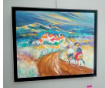
الوحات من المعرض

المغطاة بالقرميد الأحمر. ودائما مع مهنة الرعي، رسم بشير لوحة أبرز فيها راعيا مسنا يجلس فوق صخرة ويقرب منه امرأة تضع على رأسها غطاء أحمر وعدة عنزات ترعى حشائش الأرض الخصبة. لوحة أخرى رسم فيها زوج يمتطيان دراجتين، ويتجهان نحو القرية بعد جولة قاما بها في أرجاء الريف وتتعا من خلالها بجمال الطبيعة، كما رسم الفنان في هذه اللوحة سماء تتعانق الجبال ببيوتات تحادي بعضها البعض. وما أجمل أزهار الأقحوان الحمراء وهي تزين واجهة لوحة أخرى أبرز فيها بشير جمال الطبيعة بشكل آخاذ. بالمقابل، تأثر الفنان بجمال طبيعة مدينة دلس الساحلية، مستقط رأسه وكذا العديد من الدول الإفريقية والأوروبية وأمريكا اللاتينية التي