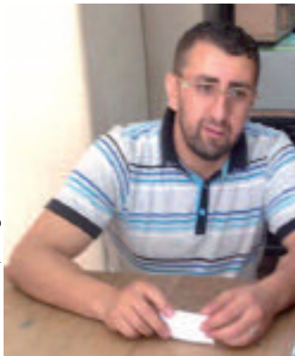
صناعة الختم بالآلة

وقال مواطن آخر دخل يستلم الختم الذي طلبه من قبل، إن الختم هو الفاصل في الأوراق والتأكد حول ما إذا كانت رسمية أم لا. وأوضح أنه صاحب مقالة ويتعامل بالوثائق مع شريك له في ولاية وهران، يؤكد أنه يرسل له بعض الأوراق عبر الأنترنت ولكن بعد طباعتها على شريكه إن يخطمها بختمه، وألا فإنها لن تقبل أبداً في التعاملات مع جهات أخرى في مجال المقاولات. ويرى ذات المتحدث أن تعميم الختم بالحاسوب والرقمنة جيد وجميل، ولكننا متأخرون كثيراً عن هذا الأمر لأن طبع الأوراق والمراسلات عبر الأنترنت من شأنه أن يشجع انتشار التزوير.. فحتى استعمال النسخ طبق الأصل وإن كانت بالألوان أي عبارة فقد تتم عن التزوير.