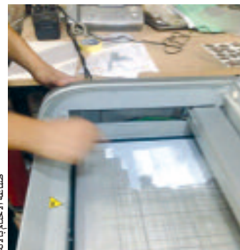
الختم على الوثائق