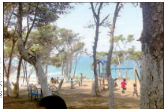
غاية 50 / 48

ويواصل السيد هنتور قائلاً: "للمحافظ على نظافة المكان عززناه بأكياس لجمع القمامة، خاصة أن الكثير من العائلات