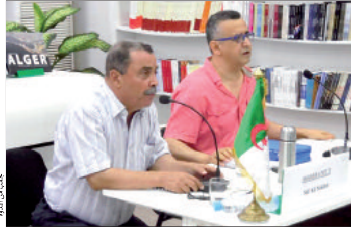
جانب من الندوة

العصرية" العالمية برئاسة جون بول سارت، ناهيك عن 300 عمل فني أنجزه مع أكبر رجال المسرح في العالم، منهم "يونسكو" وحاليا توجد أعماله في متحف "فكتوريا" بلندن.