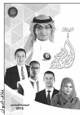
صدر عن أكاديمية الشعر في لجنة إدارة المهرجانات والبرامج الثقافية والتراثية بأبوظبي، ديوان "أمير الشعراء"