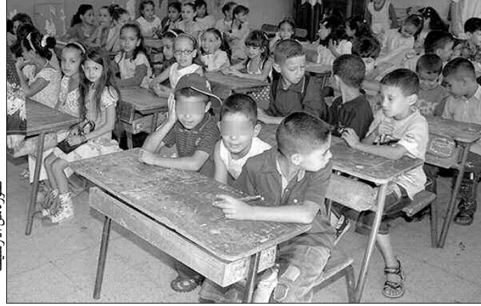
صورة من الزاوية

عبر العديد من الأولياء عن مخاوفهم من تأثير هذه الوضعية على مستوى أبنائهم ومستقبلهم الدراسي، خاصة الذين سيجتازون الامتحانات الرسمية في نهاية السنة، إذا لم تتدخل الوصاية لحل المشكل وتوفير الظروف المناسبة للتلميذ في أقرب وقت.