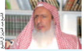
الشيخ عبد العزيز آل الشيخ

أفادت مصادر سعودية أن مفتي السعودية رئيس هيئة كبار العلماء عبد العزيز آل الشيخ، تنازل بعد 35 عاما عن الإلقاء خطبة يوم عرفة لهذا العام في مسجد نمرة بعرفات، وعزت المصادر عدم حضور المفتي وتنازله عن خطبة عرفة إلى الظروف الصحية، في حين أن برامجه التي تبث من القنوات السعودية لازالت قائمة، بالمقابل تم تكليف إمام وخطيب المسجد الحرام صالح بن حميد، للإلقاء خطبة هذا العام في مسجد عرفة اليوم الأحد 11 سبتمبر 2016.