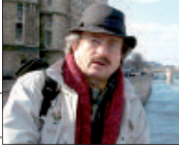
الدكتور الإيطالي باولو كانتيلي

وبهذه المناسبة، قال الدكتور باولو كانتيلي، أن المفكرين الذين أسسوا الثانوية الدولية للفلسفة بباريس وعلى رأسهم المفكر الراحل جاك دريدا، يهدفون من خلال بحوثهم إلى إبراز أهمية تعاون الفلسفة مع كل فكر آخر أو ثقافة أو علم يمكن من تحريك الفكرة وتجديد النظرية مثل الفنون والأدب والعلوم الطبيعية والعلوم الإنسانية والاقتصاد والسياسة والحقوق وغيرها.