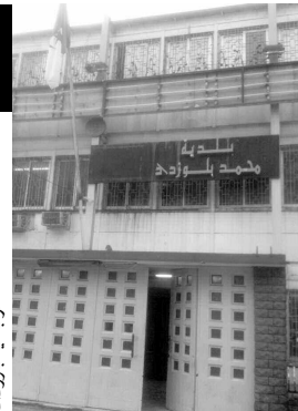
من جهة أخرى، أشار المتحدث إلى أنه تم الإعلان خلال الأيام القليلة الماضية عن مناقصة من أجل إعادة تأهيل طرق 22 حيا وتبنيها، كما يقوم المجلس بتقييم العروض واختيار المؤسسات التي فازت بالصفقة لمباشرة الأشغال قصد القضاء على القمامة السوداء بأحياء وسط المدينة التي تدهورت وضعيتها طرعا كثيرا، حيث تشمل العملية -حسب المتحدث- جميع أحياء وسط المدينة دون استثناء، على أن يتم تعميم الأشغال والانتقال بعد شهر من الآن إلى أحياء خارج المدينة، على غرار حي بن شويان، السباعيات، حوش الرويبة والأحياء المجاورة.

وفي سياق متصل، ذكر مصدرنا بعض المشاريع التي توقفت الأشغال بها نظرا لبعض المشاكل التقنية والإدارية التي تعترضها، نذكر على سبيل المثال مشروع إنجاز قاعة سينما على مستوى حي العناصر، حيث تم فسح العقد الذي كان قائما بين البلدية والمؤسسة نظرا لإهمال المقاول للأعمال